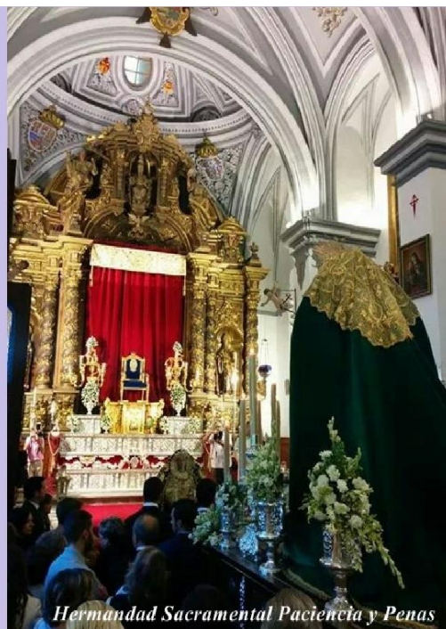
Hermandad Sacramental Paciencia y Penas